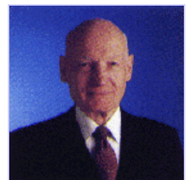
Milton Henschel, presidente de la Sociedad desde el 30 de diciembre de 1992

Presentan como "prueba" de su inspiración, el cumplimiento de las profecías que reflejan un conocimiento detallado del futuro, el contenido científicamente exacto respecto a los hallazgos más recientes y la armonía interna a pesar de haber sido escrita por 40 hombres diferentes (Cf. el artículo arriba citado).